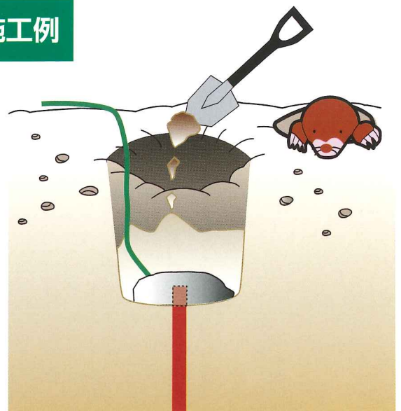
②土を埋め戻し、踏み固める。

従来通り、EP-1 20kg/袋、 パワーメッシュ 5m・10m/巻 も ご利用ください。